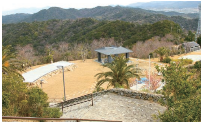
公園ゾーン(休憩棟、屋外舞台・展示スペース・トイレ)